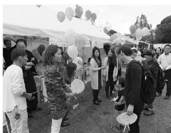
来場者に風船やうちわを手渡す