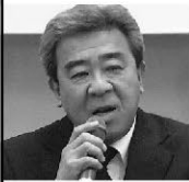
川口二宮警察署長