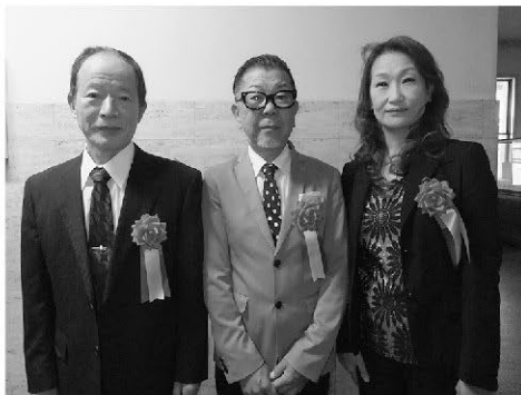
左から伊藤監事、二村常務理事、榎間常務理事