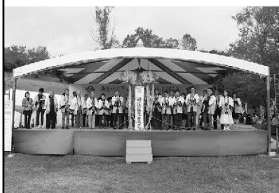
メインステージで行われた開会式