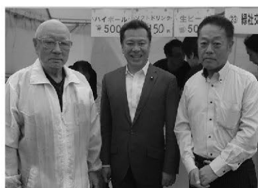
左から左京副理事長、中里名古屋市議会議員、近藤支部長