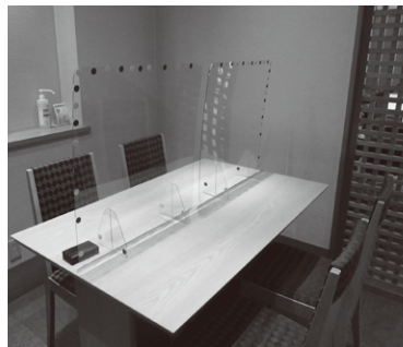
テーブルの上にアクリル板を設置