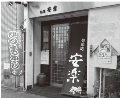
大通りに面し、店舗横に駐車場を完備