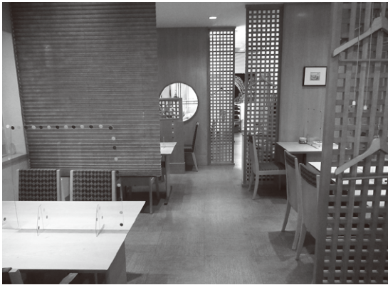
「旬菜処 安楽」の1階店内(19席)。ゆったりとテーブルが配置され、奥には天ぶらを提供するカウンター席も。2階には椅子席の和室が2室(最大24名)。