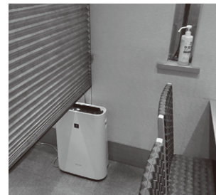
空気清浄機は以前から設置。客席上部にある換気扇を常時作動させている。