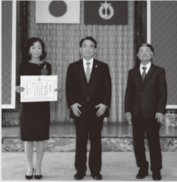
左から福園常務理事、大村知事、大谷県生活衛生連会長。 11月1日に愛知県庁で表彰式が行われました。