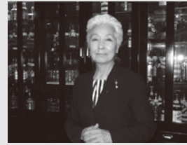
医薬・生活衛生局長表彰と中央会理事 長表彰は、11月15日にKKRホテル東 京で開催された全社連研修会(令和3 年度生活衛生関係営業対策事業)の 懇親会席上で行われました。