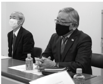
佐山会長(右)と富士本事務局長次長

会議では、「せいえいNAVI」の活用、年末の交通安全県民運動への協力、会員増強、労働保険事務組合の設立などについて連絡や確認を行いました。