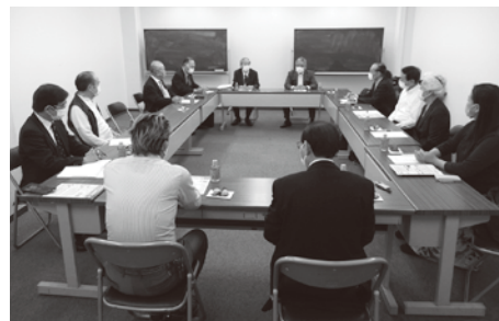
11月8日に開催した支部長会

自由討議では、出席者の近況や組合メリットなどについて語り合いました。その中で「今は新規組合員の勧誘より組合員数維持が大切。そのためには、組合員それぞれが希望する情報を、各人に労を惜みず提供し続けること」との意見が皆さんの共感を呼びました。